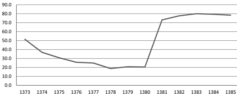
نمودار ۲- درجه باز بودن بخش صنعت در سال‌های ۸۵-۱۳۷۳ (درصد)

با توجه به جدول (۲) ملاحظه می‌شود که روند تغییرات سه شاخص آزادسازی تجاری و سهم اشتغال زنان هم جهت بوده است، یعنی در دوره ۱۳۷۳-۱۳۸۵، همراه با افزایش درجه باز بودن اقتصاد در خصوص کالاهای صنعتی، سهم اشتغال زنان افزایش یافته است. نمودار (۲) درجه باز بودن بخش صنعت را نشان می‌دهد. همان‌طور که در نمودارهای (۱) و (۲) دیده می‌شود، همبستگی مثبتی میان سهم اشتغال زنان و درجه باز بودن بخش صنعت وجود دارد. بنابراین، با آزادسازی تجاری، شاخص‌های آزادسازی تجاری افزایش یافته و به نظر می‌رسد به دنبال آن سهم اشتغال زنان نیز افزایش یابد. در واقع، آزادسازی تجاری پنجره فرصتی برای اشتغال زنان است. برای آزمون دقیق فرضیه مذکور در قسمت‌های بعد پس از برآورد مدل‌های اقتصادسنجی به بررسی آن خواهیم پرداخت.